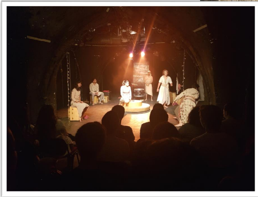
الف ليلة وليلة